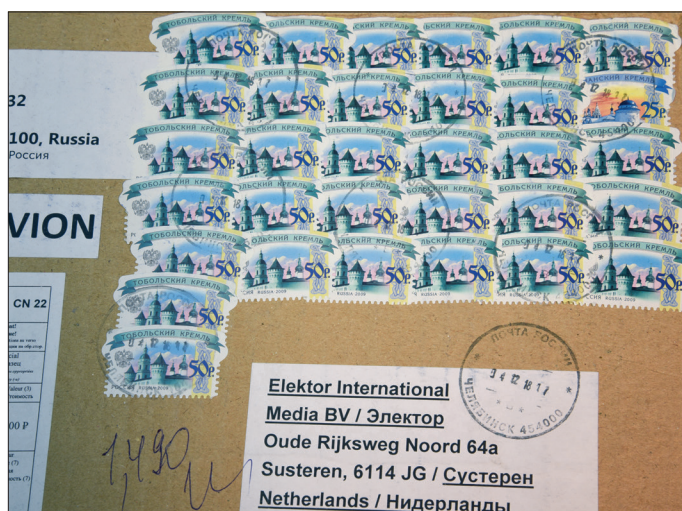
Intéressant pour les philatélistes.