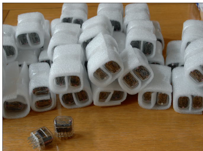
Emballage soigné dans de la mousse.