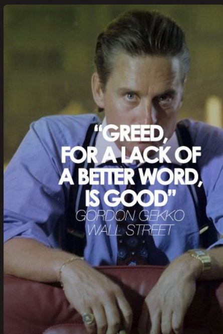
La célèbre réplique de M. Douglas dans le film Wall Street de 1987. Ne vaudrait-il pas mieux dire « L'avidité verte est bonne » ?

Le comité du WEEF n'est pas convaincu de l'utilité de tels « labels verts ». Prenez la certification B Corp : répondez à