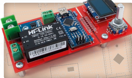
Mini plaque de refusion pour l'assemblage ou la réparation de petits circuits CMS