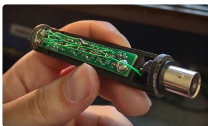
Microphones MEMS conception et construction